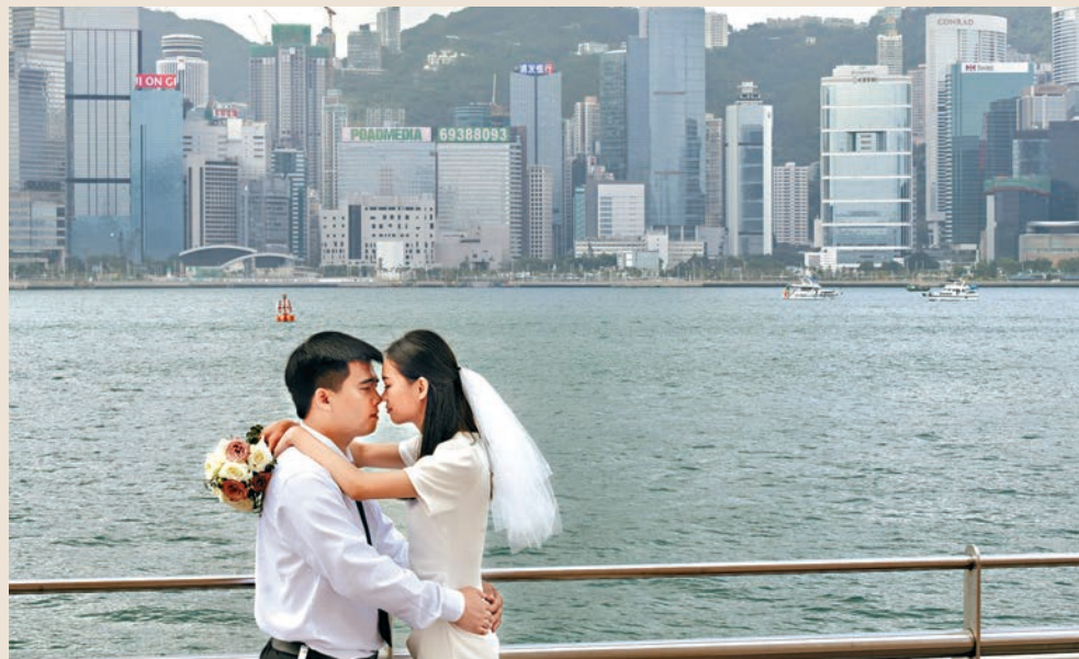
本港結婚人口比例持續下降。

本報根據人口普查和中期人口統計，按年齡組別以及性別，比較各組已婚和從未結婚的人口比例，以及每1000名已婚女性的活產嬰兒數目等，顯示近年除了15歲至19歲已婚女性的活產嬰兒數目有較大波幅（表一），其餘年齡層的已婚女性活產嬰兒數量尚算平穩。總和方面，1991年有964名活產嬰兒，2021年跌至733名，惟若扣除15歲至19歲已婚女性的活產總和，1991年是557名，2011年和2016年上升至近800名，至2021年才下跌至約537名，數字上與30年前相距不大。