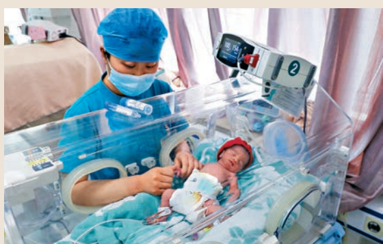
生育率低成為世界性問題。

意見，同時須考慮醫療系統的資源分配，指過去多年來，人類生殖科技管理局一直有收到意見和建議，當中涉及醫學科技和臨牀程序，更牽涉更廣泛和甚具爭議性的道德及社會問題，社會未有充分共識，將密切監察公眾意見。