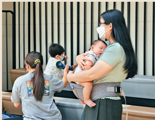
市民普遍較少生育三個嬰兒或以上。

本港出生率持續下降，總和生育率於2021年跌至0.77，遠低於2.1的自然人口補充率。本報翻查近30年來合共7次的人口普查及中期人口統計，按生育齡期（即15歲至49歲）劃分組別，比較已婚和未婚比例人口，以及每1000名已婚女性的活產嬰兒數目等，顯示已婚女性的生育狀況大致維持，但已婚人口比例卻大幅減少。有專家認同，婚育兩者具高度關連，建議政府除了現行鼓勵生育的措施，也應考慮制定支援婚姻的政策，並正視非婚者生育權等，全方位提升生育率。