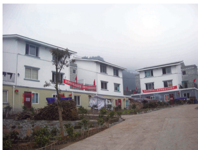
圖 1：新統建的永久安置區

但在安置房的現代化的房子之間，在空地中有一以木板及塑料布蓋搭成的小木屋（見圖2）。原因是居民認為用電取暖電費太貴、在室內燒柴又會燻黑牆壁，所以部分居民選擇在室外搭建小屋以燒柴來取暖。