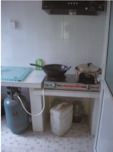
圖 3：現代化但絕少使用的廚房