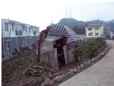
圖 2：取暖用的小木屋

在新建成位於房屋地下的廚房中，有現代化的天然氣爐具及抽油煙機，有關設備是由政府免費提供，但從牆壁及廚具光亮的外表可得悉廚房及廚具均絕少使用（見圖3）。