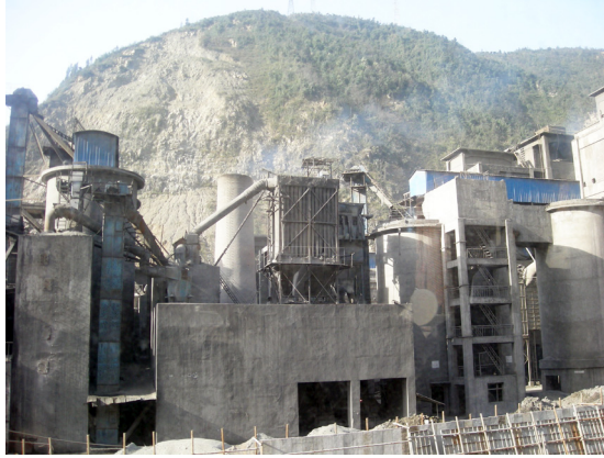
圖 5：北川附近的水泥廠

基本生活需要。而在為了加快重建的速度及減低生產的成本，大量水泥廠的建設亦忽視人與自然環境互相依存的關係，地震後本來經已非常脆弱的生態很可能無法復原。所以在重視硬件建設之外，我們亦要重視人文層面的保育及建設。