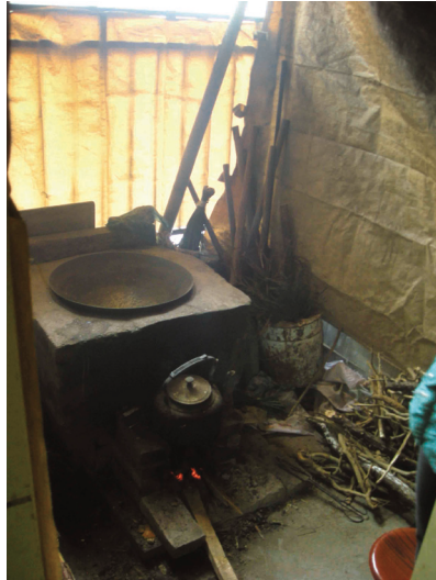
圖 4：居民自己搭建的傳統廚房

產建設水泥需求量高達9,959萬噸。為了滿足巨大的需求和減少運輸成本，一座座水泥廠在四川當地如雨後春筍拔地而起。這些水泥廠一般規模較小（見圖5），為應付大量的生產任務，往往降低對生產設備的環保標準要求和對原料的質量要求，因而在製造水泥的過程中會產生大量的粉塵、二氧化硫、氮氧化物和氟化物等污染物，給當地環境造成嚴重破壞。進而危害周邊居民的健康，一方面降低他們的勞動能力，另一方面亦增加了居民的醫療負擔。長遠來說，更進一步破壞了人與自然的關係，可能帶來另一次生態的災難。